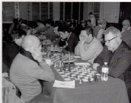
Ultime sfide al Città di Legnano

Ottimo risultato per la squadra principale della Famiglia Legnanese nella finale del trofeo Lombardia svoltosi domenica 11 gennaio a Lentate sul Seveso. Terzo posto assoluto, ormai da 10 anni consecutivi siamo sempre tra le prime quattro formazioni regionali. Approfondimenti sul prossimo numero della Martinella.